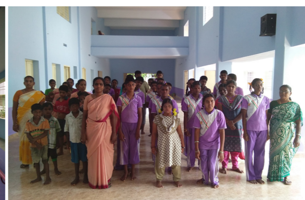
De zusters hebben het gebouw van Colourful Children weer prachtig opgeknapt. Een voorbeeld van goed onderhoud in India.